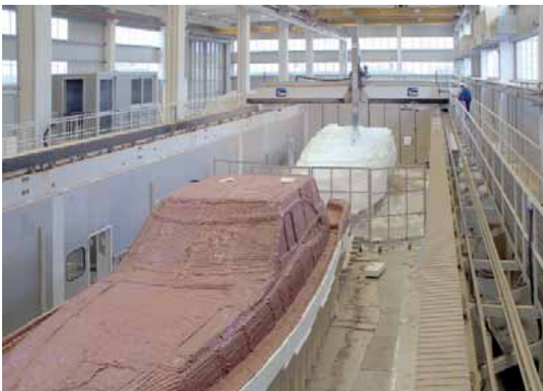
Una soluzione CMS applicata al settore della nautica.

Per ogni diversa strategia il sistema calcola automaticamente il tempo stimato e la lunghezza del percorso utensile. Infine, è possibile visualizzare e verificare il percorso utensile prima che questo venga trasmesso alle macchine, eliminando perdite di tempo e di materiale. ■■■