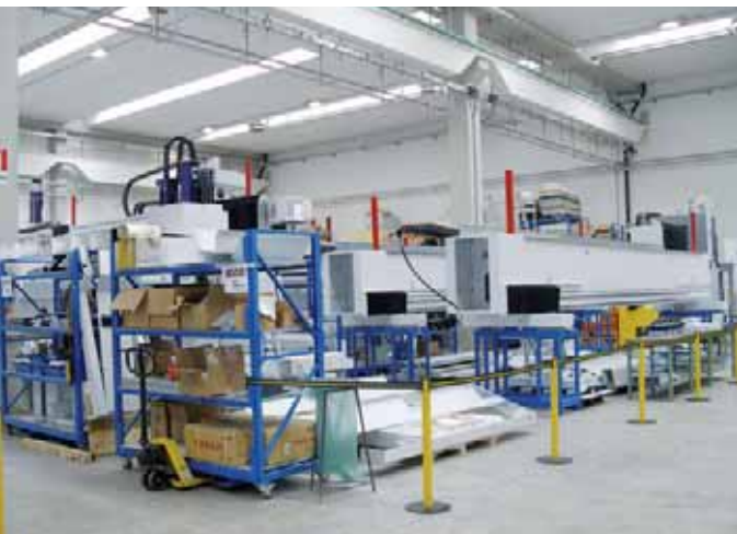
Vista dei reparti produttivi CMS.