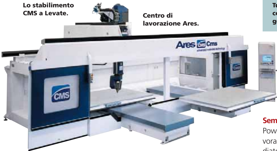
Tutti i percorsi della fresatrice CMS del costruttore nautico Numarine vengono generati dal software PowerMILL di Delcam.

with Boeing): PowerMILL è utilizzato per la programmazione di una grande macchina utensile CMS a cinque assi che è stata recentemente installata per la lavorazione di componenti e la finitura di parti con tecniche di profilatura e foratura a cinque assi.