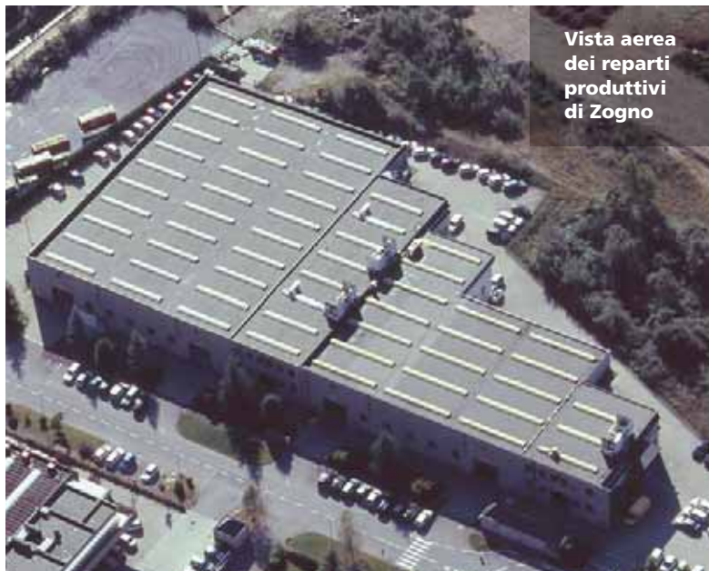
Vista aerea dei reparti produttivi di Zogno

Cronus, infine, è il modello dal quale è nata la nuova Cronus K. Le corse che vanno da 1.500 x 2.600 x 1.300 mm fino a 20.500 x 5.000 x 2.000 mm e gli elettromandri fino a 28 kW / 24.000 giri/min rendono queste macchine particolarmente idonee alla la-